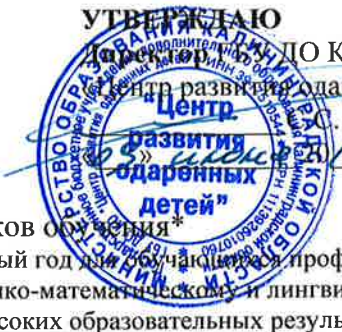
График потоков обучения* в Центре развития одаренных детей на 2014/2015 учебный год для обучающихся профильных физико-математических и лингвистических классов опорных школ по физико-математическому и лингвистическому направлениям, и учащихся, достигших высоких образовательных результатов